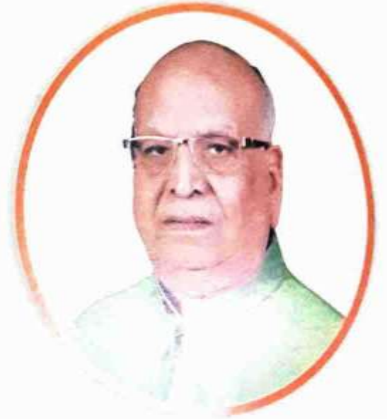
पूज्य श्री लाल जी टण्डन तत्कालीन नगर विकास मंत्री, उ०प्र०